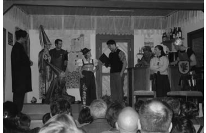
Szene aus „So ein Theater“

Das wohl größte Ereignis ist erst im Oktober über die „Bühne“ gegangen: die Theateraufführung „So ein Theater“. An dieser Stelle möchten wir uns auch besonders bei allen Freiwilligen bedanken, die ihre tatkräftige Hilfe angeboten haben.