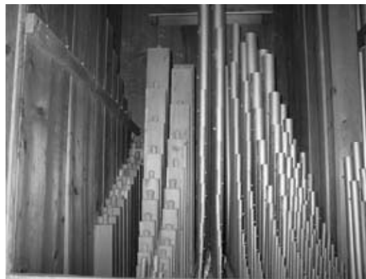
Diese frisch gestimmten Orgelpfeifen sorgen für den „guten Ton“ bei den Hl. Messen!

Nach den Fresken wurde das Projekt „Orgelreinigung“ in Angriff genommen. Am 12. August wurde der Blasbalg zwecks Neubespannung vom Orgelbauer ausgebaut und